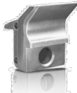
Blade BL OPTIONAL