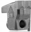
C/3/SS sx STANDARD