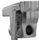
C/3/SS dx STANDARD